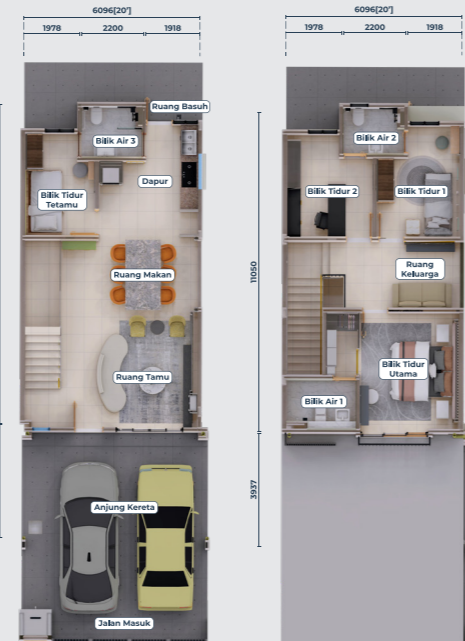
Pelan Aras Tanah