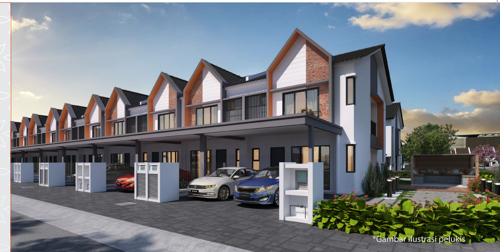
*Gambar ilustrasi pelukis

Maklumat adalah tertakluk kepada perubahan oleh pihak berkuasa tempatan / Arkitek / Jurutera