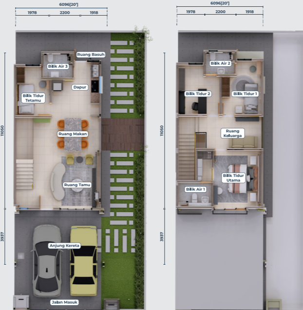
Pelan Aras Tanah