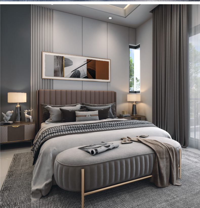
*Gambar ilustrasi pelukis